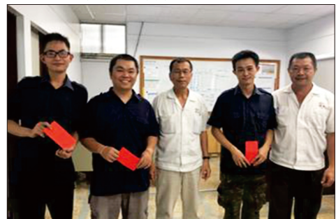
取得專業證照同仁獲得獎勵