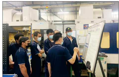
種子講師訓後指導